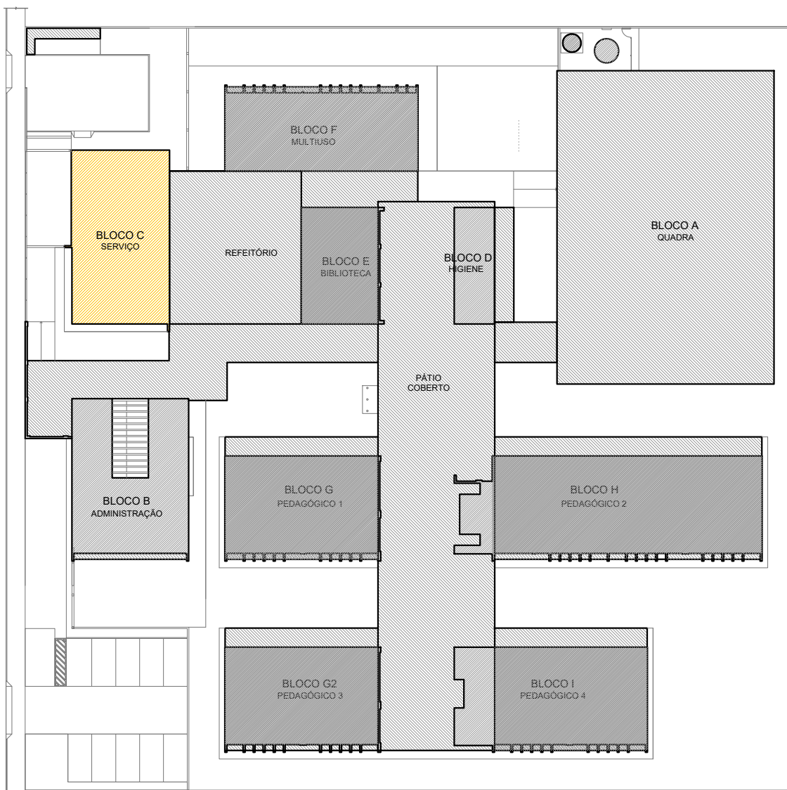
CROQUI DE REFERÊNCIA